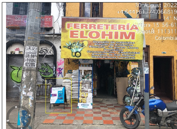
Fotografía No. 3. (por Calle 57) se evidencia UN (1) elemento no regulado instalado en área que constituye espacio público.