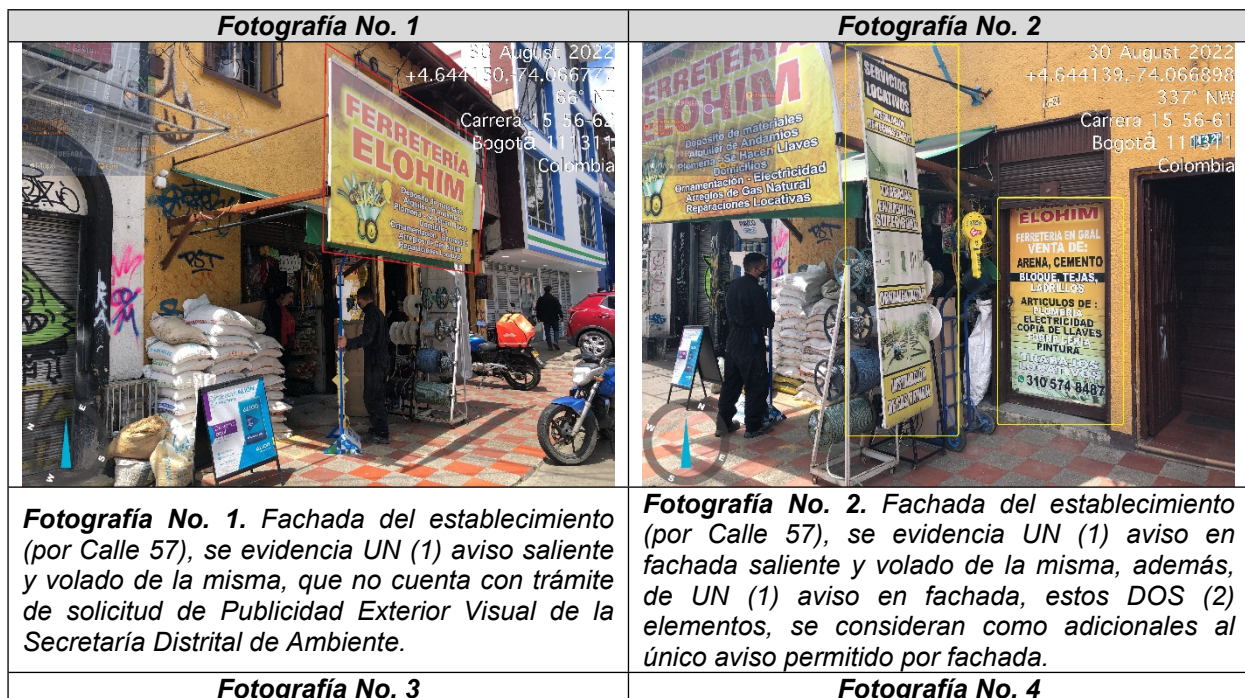
Tabla 3. Registro fotográfico

En las condiciones actuales de instalación de los elementos, no son susceptibles de solicitud de registro, toda vez que no cumplen con la normatividad legal ambiental vigente. Valoración técnica y conductas generales evidenciadas (Ver Anexo No. 1. Acta de Visita No. 204787)