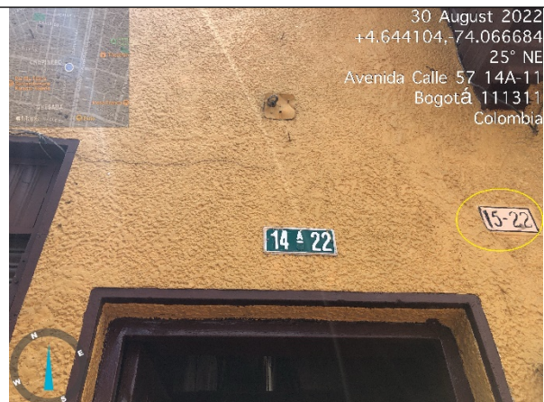
Fotografía No. 4. Nomenclatura urbana del inmueble (CL 57 NO. 15 - 22)